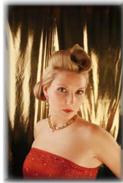
Preis 189.- € Art.Nr. FL3702-3038