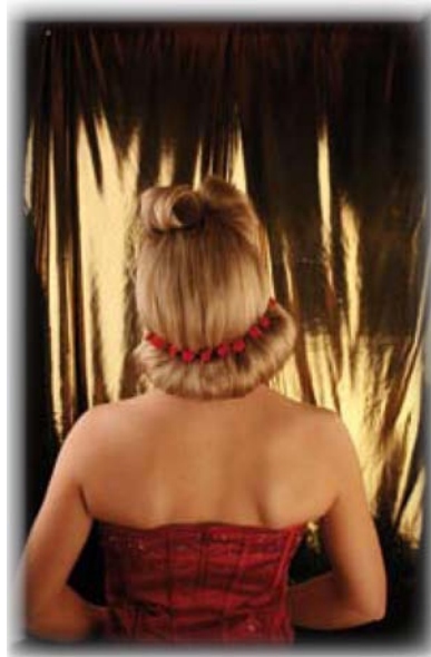
Preis 189.- € Art.Nr. FL3701-3023